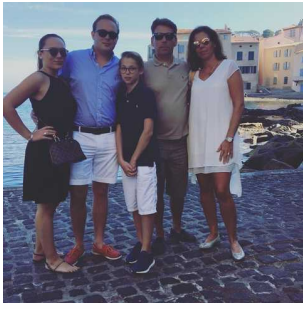
Objekt ID: 59219